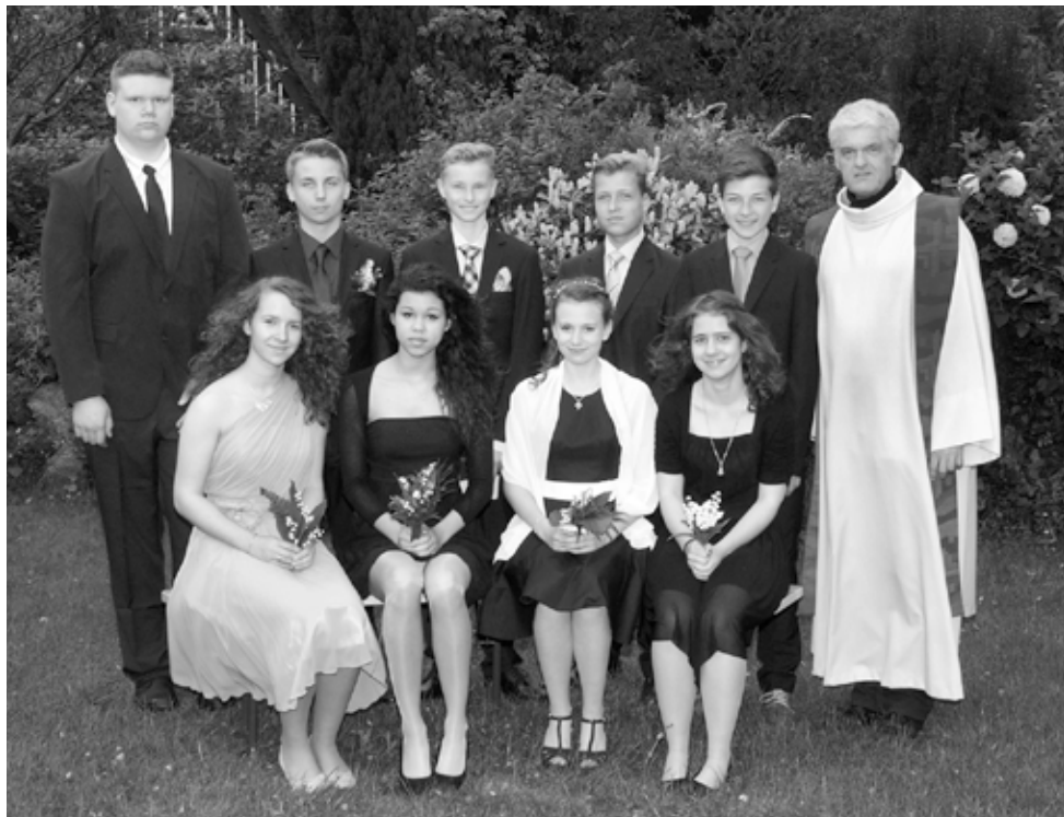
Neun Jugendliche wurden am 10. Mai konfirmiert